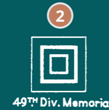
49th Div. Memorial

De oorspronkelijke medische eenheden die hier in 1915 gestationeerd waren, groeven rudimentaire schuilplaatsen in de wal achter de begraafplaats. In 1917 waren ze intussen versterkt met beton. Vandaag kan je de schuilplaatsen bezoeken en je voorstellen in wat voor barre omstandigheden het medisch personeel zijn cruciale werk moest verrichten.