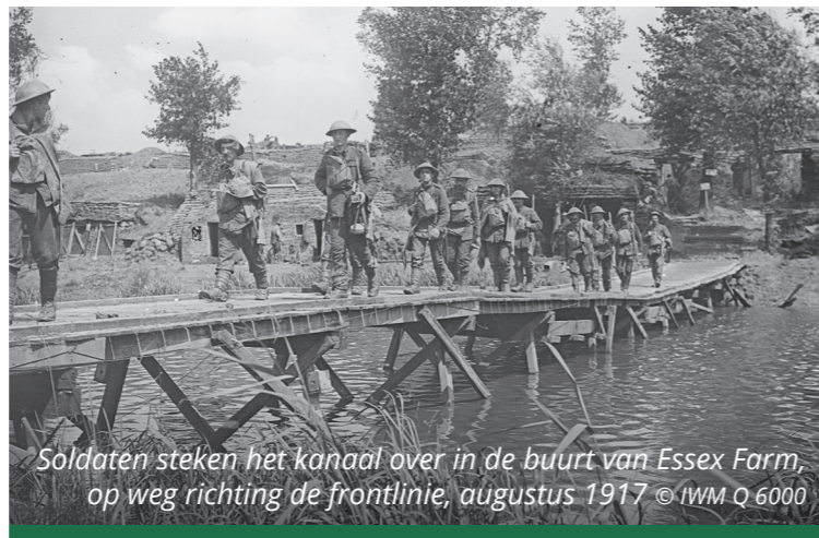
Soldaten steken het kanaal over in de buurt van Essex Farm, op weg richting de frontlinie, augustus 1917